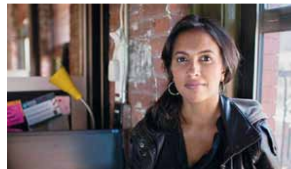
La regista del film Coded Bias Shalini Kantayya

Il mese di ottobre che ci si spalanca di fronte è una finestra sul mondo e sulle arti. Ogni settimana propone un festival, una rassegna, un'inaugurazione: occasioni di scoperta, riscoperte e confronto. Segnali di una comunità viva, attiva e attenta a guardare se stessa, per capirsi, e a guardare gli altri, per capire il mondo. Rete Due a sua volta spalancherà occhi e orecchie per fare da testimone e con le sue voci contribuirà a comporre il ritratto del nostro contemporaneo.