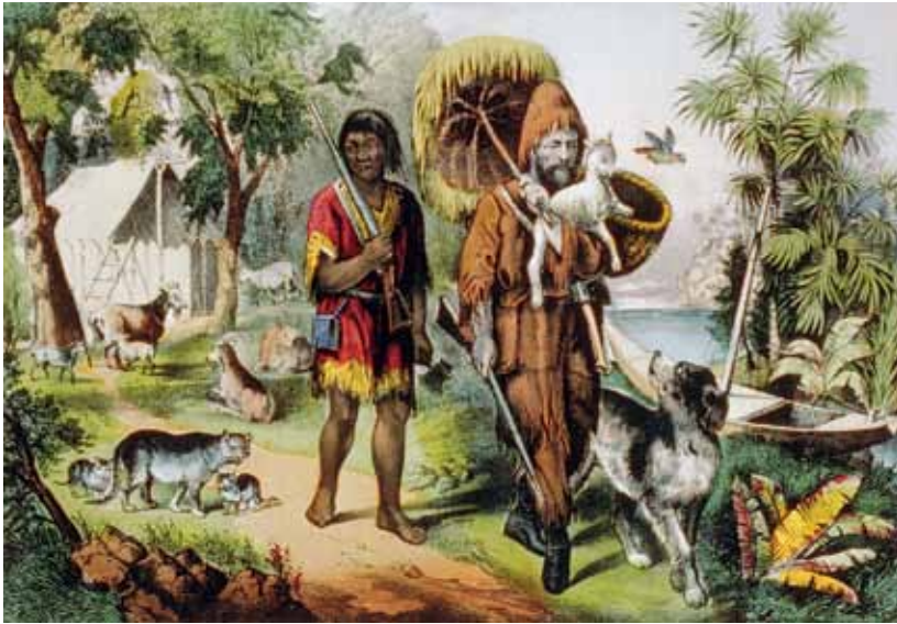
Robinson Crusoe con Venerdì, litografia dipinta a mano, 1874.

atro e della scena contemporanea che festeggia quest'anno il traguardo della trentesima edizione. In scena nelle sale del LAC e al Teatro Foce artisti e compagnie di richiamo internazionale, alcune esperienze tutte da scoprire, come quelle che ci vengono proposte attraverso un focus dedicato alla scena portoghese, altre proposte invece più consolidate come ad esempio l'atteso ritorno di Romeo Castellucci. Il fondatore della Societas Raffaello Sanzio, che tra i tanti riconoscimenti vanta anche un Leone d'oro alla Biennale di Venezia e il titolo di Chevalier des Arts et des Lettres della Repubblica francese, presenterà il nuovissimo BROS in cui degli pseudo-attori, un gruppo di uomini anonimi - chiamati dalla strada - vengono guidati in scena da un