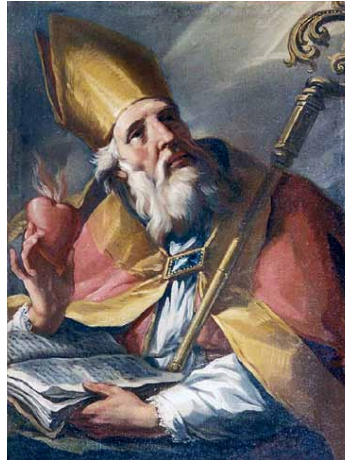
Sant'Agostino (Aurelio Agostino d'Ippona 354-430) è stato un filosofo, vescovo e teologo romano. Olio su tela, metà del XVIII secolo, Italia.