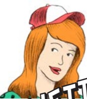
GIULIETTA LA SOGNATRICE