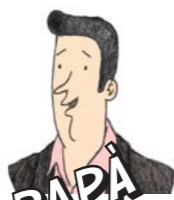
PAPÀ IL PRESUNTO CAMPIONE SPORTIVO