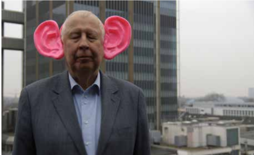
«HANS-PETER FELDMANN – KUNST KEINE KUNST» DE CORINNA BELZ

L'art au cinéma, le cinéma dans l'art : les artistes et les cinéastes se renvoient la balle depuis l'invention des images animées. Les cinéastes braquent volontiers leurs caméras sur l'art, le marché de l'art et ceux qui le font. A l'inverse, les artistes sont fascinés par l'univers du cinéma et leurs œuvres en témoignent.