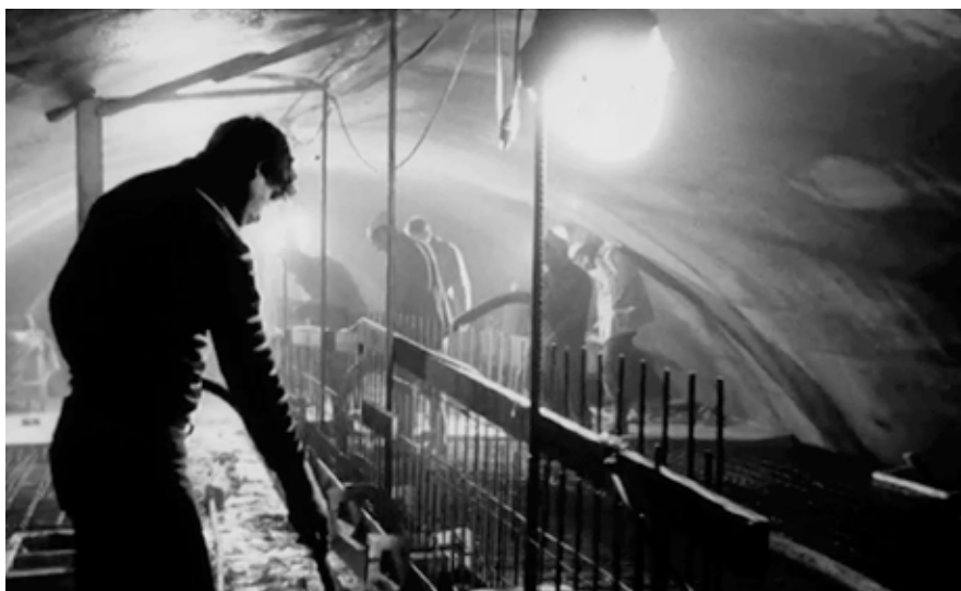
«PROBLEMZONE GOTTHARD» CH 1964–2006

L'ouverture du tunnel de base du Saint-Gothard fera date dans l'histoire. Le site a enflammé très tôt l'ambition des ingénieurs et des constructeurs de tunnels et cela n'a rien d'étonnant. Hommage au gigantesque ouvrage.