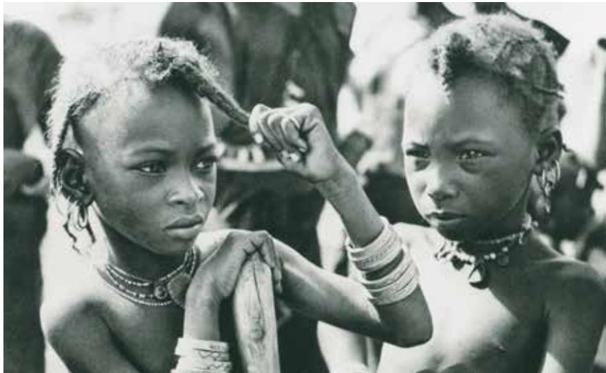
«LES NOMADES DU SOLEIL» DE HENRY BRANDT

Déjà dans les années 1930, explorateurs et journalistes documentaient leurs voyages avec la caméra. Ils ont réalisé des films ethnographiques et des films d'aventures spectaculaires et ont tenté des explications pédagogiques. Ces films parlent de la perception que l'on avait alors de l'«étranger».