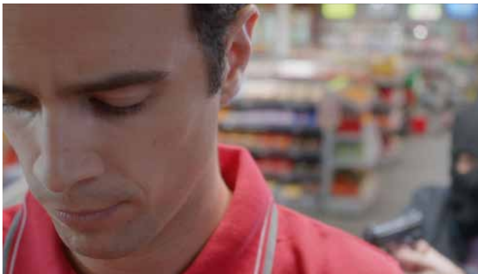
«MARTIEN» VON MAXIME PILLONEL

Le jeune cinéma a droit à une attention toute particulière dans «Panorama Suisse»: «Upcoming» est entièrement placée sous le signe de la découverte et de l'encouragement des talents de la relève. Le programme «Upcoming Talents» propose des courts métrages réalisés par des étudiants des hautes écoles de cinéma suisses et étrangères et par des jeunes autodidactes. Quelques-uns ont été accompagnés par des producteurs suisses. Un jury de trois personnes attribue le prix de la relève institué par SSA / SUISSIMAGE, d'un montant de 15'000 francs.