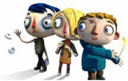
«WATCHOUT! – MA VIE DE COURGETTE» VR MOBILE GAME

Quatre festivals internationaux présentent leurs coups de cœur et expliquent leurs modalités de sélection des films lors d'une table-ronde. Les invités sont les responsables de programme de DOK Leipzig, du FIDMarseille, du San Sebastian International Film Festival et des Internationale Kurzfilmtage Oberhausen. Informations en page 30.