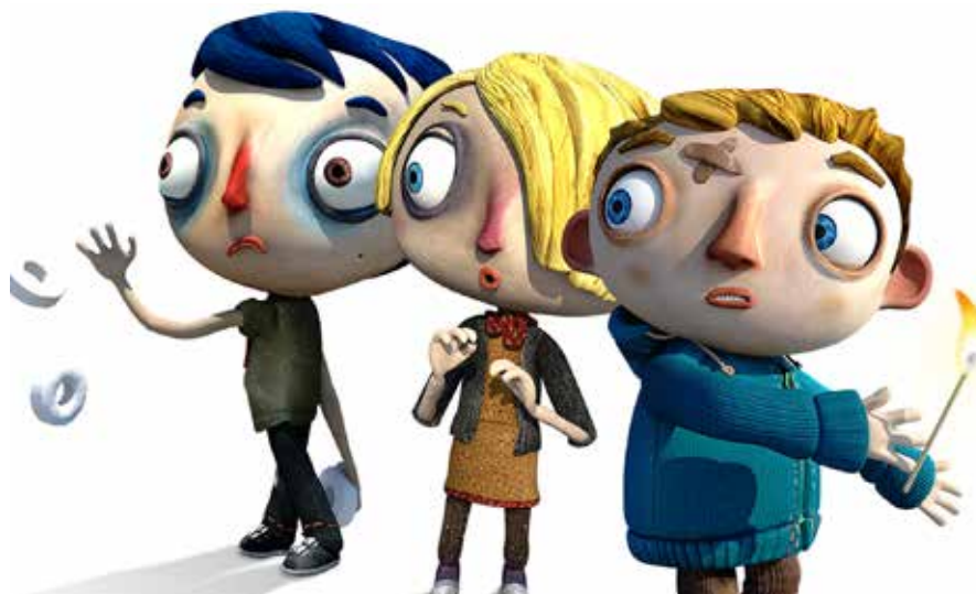
«WATCHOUT! – MA VIE DE COURGETTE» VR MOBILE GAME

L'innovation technologique permet de nouvelles formes narratives et invite le spectateur à endosser un nouveau inédit. Les 52 es Journées de Soleure présentent au Landhaus, plus précisément à la Säulenhalle, une sélection de projets en réalité virtuelle.