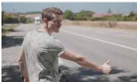
«L'INCLINAISON DES CHAPEAUX» DE ANTONIN SCHOPFER ET THOMAS SZCZEPANSKI