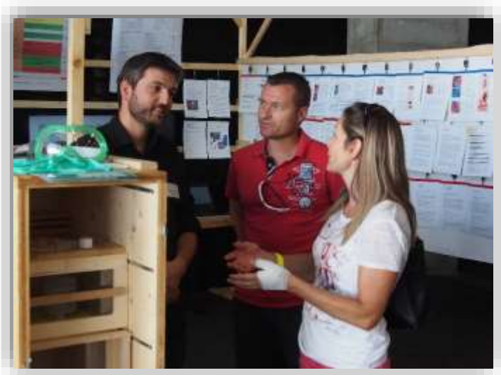
Consulenza in occasione di «L'Abeille en fête»