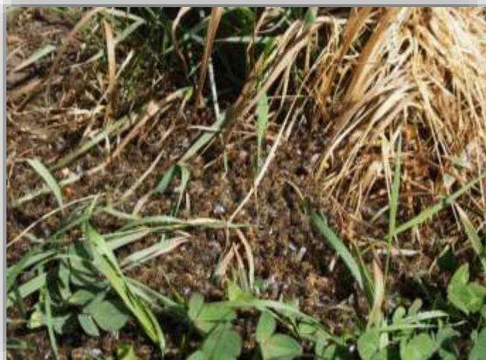
Api intossicate in massa

Nel 2016 sono stati segnalati al SSA 19 casi sospetti d'intossicazione di api, in linea con la media degli ultimi tre anni. Quattro campioni di api non hanno purtroppo potuto essere analizzati a causa della loro cattiva qualità (ad es. decomposizione avanzata, impurità, non abbastanza api). Su 15 campioni è stata effettuata una ricerca in laboratorio di eventuali residui di prodotti fitosanitari. 11 sono risultati esenti da pesticidi. Per 4 campioni, l'analisi effettuata ha confermato il sospetto d'intossicazione. Tra le quattro intossicazioni dimostrate, un risultato ha chiaramente lasciato supporre un avvelenamento volontario, mentre in due casi non è stato possibile determinare l'origine esatta dell'intossicazione. L'ultimo caso, il più pesante, ha riguardato diversi apiari. Le 68 popolazioni di api hanno subito gravi danni a seguito dell'applicazione negligente di un neonicotinoide (Thiamethoxam) da parte di un arboricoltore.