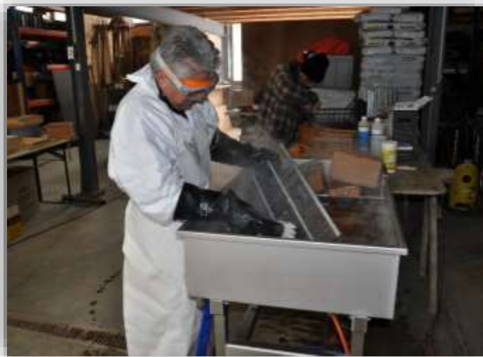
Esempio di utilizzo della vasca di lavaggio manuale

Dal 2016, è possibile prendere in prestito dal SSA solo la vasca per il lavaggio manuale per operazioni di pulizia/bonifica. Il kit di lavaggio è composto da una vasca (con coperchio e piano di lavaggio per i piccoli oggetti), un bruciatore a gas, nonché dei dispositivi di protezione individuale; può essere ritirato a Liebefeld o inviato tramite Cargo Domicilio. La vasca di lavaggio è stata utilizzata tre volte finora, oltre che in occasione di diverse dimostrazioni: 1 volta per un'epizoozia e 2 per dei normali lavori di pulizia.