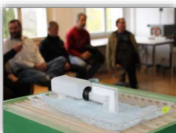
Corso di perfezionamento centrato sulla pratica (es. Nassenheider professionale)

In occasione delle manifestazioni, il Servizio sanitario apistico lavora in stretta collaborazione con i consiglieri delle sezioni interessate, nonché con altri responsabili apistici. Il fatto di integrare e accettare dei consiglieri è spesso determinante per il successo di una manifestazione.