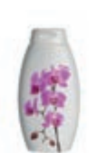
Prodotti a base di orchidee