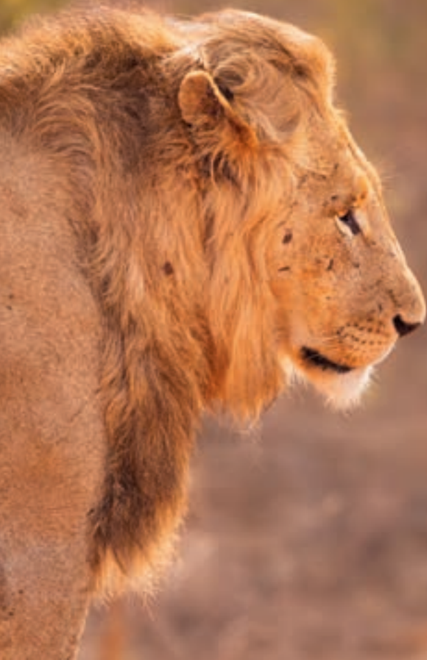
Immagine a sinistra: leone | Immagine a destra: pangolino