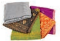
Scialli in shahtoosh prodotti con lana di antilope tibetana