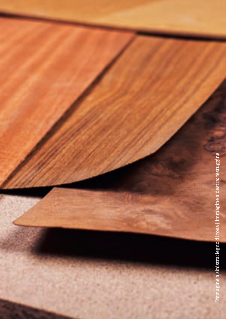
Immagine a sinistra: legno di rosa | Immagine a destra: testuggine