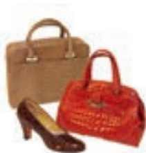
Merci in pelle di cocodrillo