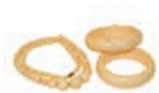
Merchi in avorio

In Svizzera l'esecuzione pratica della Convenzione spetta all'Ufficio federale della sicurezza alimentare e di veterinaria (USAV). Fra i suoi compiti, svolti in collaborazione con l'Amministrazione federale delle dogane e altre autorità nel Paese e all'estero, rientrano