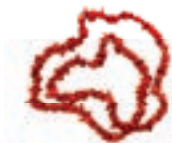
Gioielli in corallo rosso